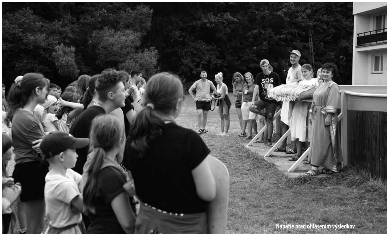
Napätie pred ohlásením výsledkov