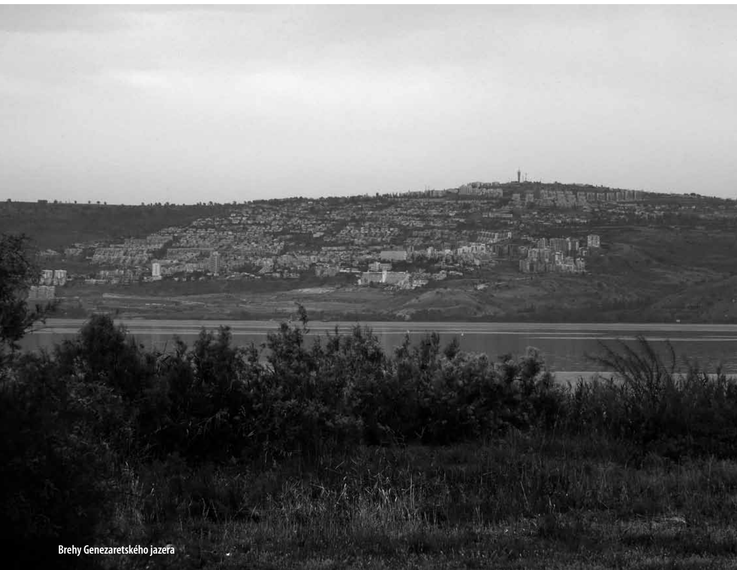
Brehy Genezaretského jazera