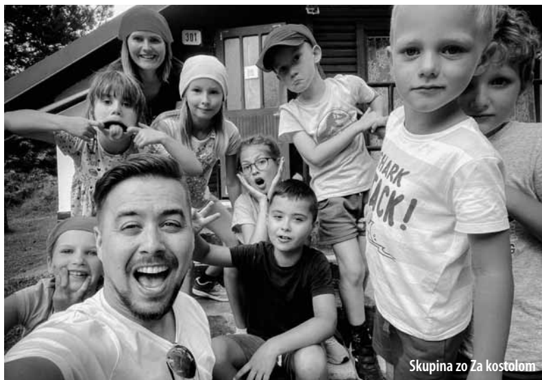
Skupina zo Za kostolom

VeDeLePoCiBr alebo Veľký detský letný pobyt Cirkvi bratskej je pojem, o ktorom sme už v Dialógu písali. Je to unikátny projekt, ktorý trvá od roku 2007. Koná sa každé dva roky, čiže tohoročný tábor bol v poradí ôsmy. Ponúka sa tu jedinečná príležitosť, aby sa zapojili aj malé zbory či zbory s málo deťmi, ktoré by nezvládli vlastný detský tábor. Deti môžu zažiť, čo to znamená cirkev vo veľkom, vytvárajú si priateľské vzťahy naprieč krajinou, ba dokonca spoločne vyrastajú. Lebo, kto raz príde, ten už chodí stále. Podobne sa tu stretávajú služobníci z rôznych kútov krajiny a každý zbor v tomto smere môže ponúknuť obdarených hudobníkov, výtvarníkov či športovcov. Jeden sa učí od druhého, zo zboru do zboru sa odovzdáva to najlepšie know-how služby. Pre všetkých je tábor nesmiernym obohatením.