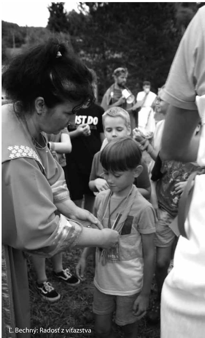
L. Bechný: Radosť z víťazstva

Časopis Dialóg vychádza s podporou Cirkvi bratskej, ale obsah jednotlivých príspevkov nevyhnutne nevyjadruje duchovné presvedčenia Cirkvi bratskej.