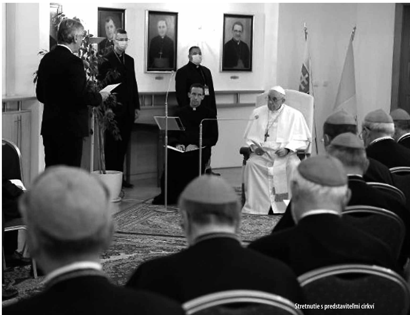
Stretnutie s predstaviteľmi cirkví

Pápež František je prechodovou postavou. Čas ukáže, ako veľmi bude latinskoamerický, kuriálny, jezuitský a františkánsky. V jeho prvom krátkom príhovore pred aplaudujúcim davom na námestí svätého Petra bola najviac citovaná osobou pan-na Mária, ktorej zaviazal seba aj svojho predchodcu. Jeho prvý počin v prvý deň jeho pápežstva bola návšteva mariánskej baziliky Santa Maria Maggiore v Ríme, kde sa modlil k Márii s prosbou o sprevádzanie a pomoc. Bol to viac jezuitský ako františkánsky začiatok pápežstva. ■