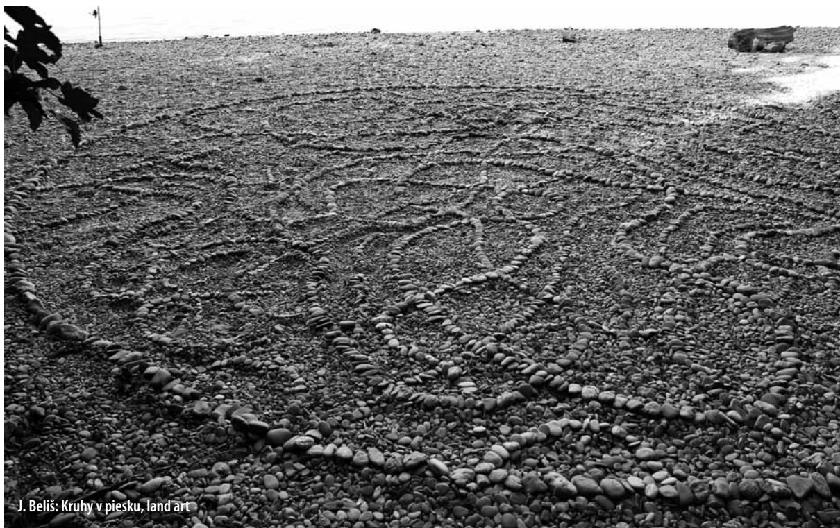
J. Beliš: Kruhy v piesku, land art

Pane mojej duše, keď si putoval tu po našej zemi, neopovrhoval si ženami, ale vždy si ich skôr zahrňoval blahosklonnosťou a nachádzal si v nich toľko lásky, a dokonca viac viery než u mužov. .... Preto sa nám vidí nemožné, že by sme nemohli urobiť pre Teba vo verejnosti čosi hodnotné, že by sme sa neopovážili povedať otvorene nejakú pravdu, že by sme plakali v tajnosti, pretože nás nevypočuješ, keď sa obrátíme k Tebe s takou spravodlivou prosbou? Neverím tomu, Pane, pretože dôverujem Tvojej добрote a spravodlivosti. Viem, že si spravodlivý sudca a nepostupuješ ako sudcovia sveta, pre ktorých, keďže sú Adamovi synovia a definitívne všetci mužovia, nejestvuje ženská čnosť, ktorú by nepodozrievali. Ó, môj Kráľ, predsa musí prísť deň, v ktorom sa všetci budú poznať podľa toho, čo v skutočnosti sú. Nehovorím za seba, lebo svet už pozná moju biedu a teším sa tomu, že sa vo verejnosti pretriasa. Vidím však črtať sa časy, keď už viac nebude dôvod podceňovať čnostných a silných duchov iba pre tú jednu skutočnosť, že patria ženám.