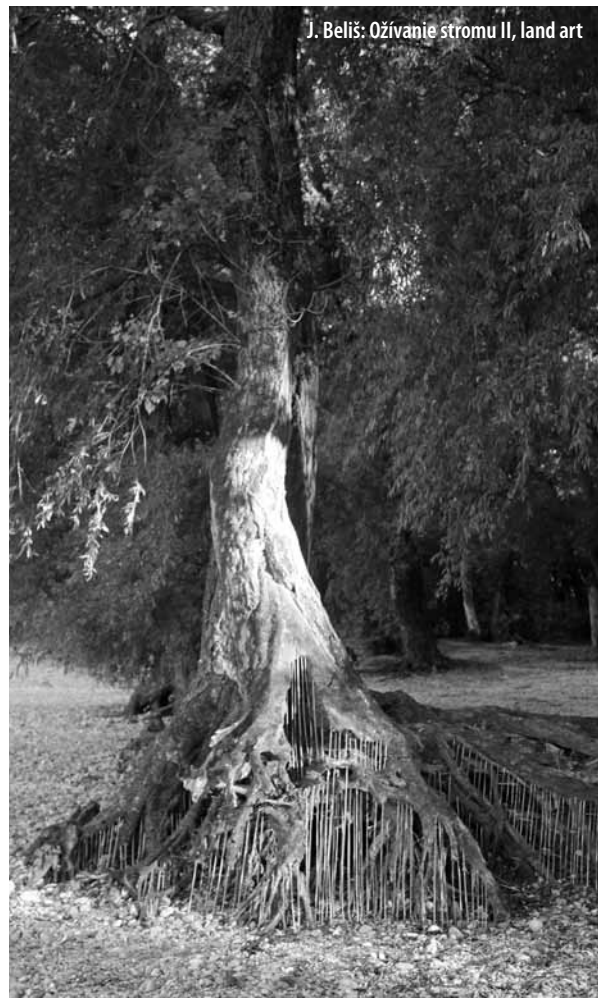
J. Beliš: Ožívanie stromu II, land art

Nech nám v tom budovaní rovných vzťahov založených na vzájomnej láske pomáha Boh. ■