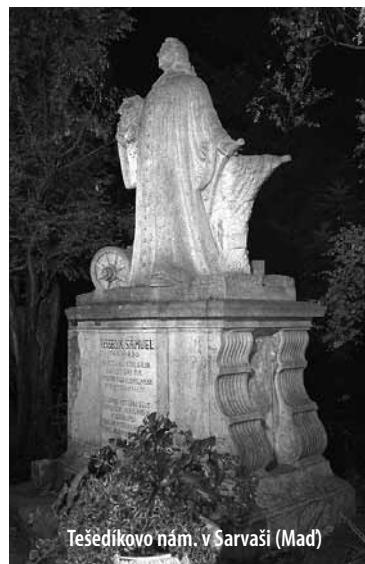
Tešedíkovo nám. v Sarvaši (Maď)

Samuel Tešedík ml. zušľachtil ľudí i zem. Jeho meno je dodnes známe v Maďarsku aj na Slovensku, kde bola po ňom pomenovaná obec Tešedíkovo. Pri tom všetkom však prestal byť farárom. Toto svoje najdôležitejšie poslanie sa snažil verne konať až do svojej smrti. Po vianočných sviatkoch roku 1820 sa dňa 27. decembra odobral k Tomu, ktorý určil človeka za správcu zeme a On sám mu pripravil príbytok v Jeho kráľovstve. ■