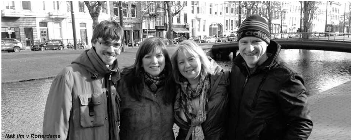
Náš tím v Rotterdame