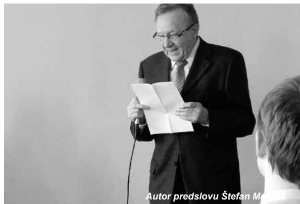
Autor predslovu Štefan M.

myšlienka priťahovaná tvorivosťou priestor v ktorom žijeme bod na ktorom stojíme stopa po ktorej kráčame vernosť láska úcta