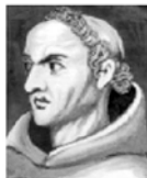
William (z) Ockham, 1288-1348

„ Entia non sunt multiplicanda praeter necessitatem ”