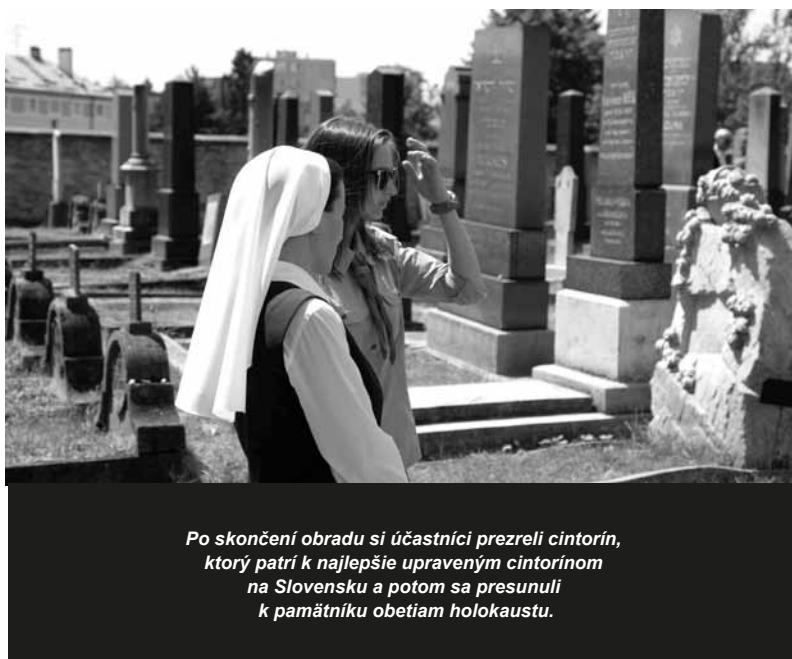
Po skončení obradu si účastníci prezreli cintorín, ktorý patrí k najlepšie upraveným cintorínom na Slovensku a potom sa presunuli k pamätníku obeť holokaustu.

Po smútočnej tryzne sa uskutočnila Pietna spomienka pri pamätníku, nazvanom „Cesta bez návratu“ na Závodskej ceste. Pamätník je umiestnený presne tam, kde bol od marca do októbra roku 1942 počas 2. svetovej vojny zriadený zberný tábor na deportáciu židovských spoluobčanov z celého Slovenska. Zberný tábor zriadili vo vojenských objektoch Štefáni-