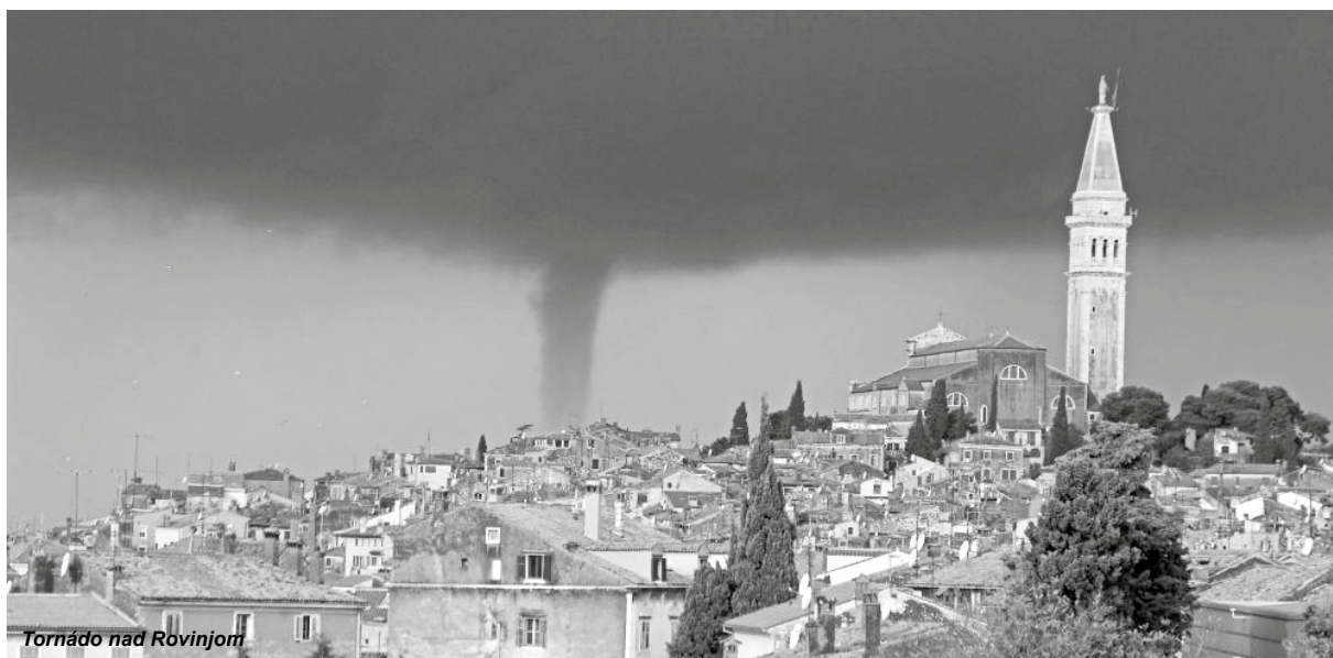
Tornádo nad Rovinjom

o co více to platí dnes. Boj který v mém životě probíhá mezi tělem a Duchem, přesně odráží boj mezi Božím světem a tímto světem. Nevychované a panovačné tělo neustále a vytrvale žádá přesný opak toho, co chce Duch. Neexistují tu žádné společné zájmy, žádná možnost dohody či jednoty. Tělo v tomto smyslu a Duch jsou dva naprosto nesmiřitelné a nepřátelské světy. Duch chce lahodit Bohu a tělo lidské soběstřednosti. Není náhodou, že Pavel nabádá v předchozím verši k tomu, abychom vydávali své tělo Bohu v oběť živou, čímž se myslí naše rozumná služba. To je totiž jediný způsob jak své tělo převychovat v poslušné „oslátko“ které nás bezpečně doveze až do nebeského Jeruzaléma. Tělo lne k tomuto světu a vtahuje nás do něj, do jeho zájmů, jeho cílů, do jeho životního stylu. Snaží se propašovat do našeho ducha světský řebříček hodnot, světský způsob myšlení a jednání. Takto se stáváme podobní tomuto světu, a takto se stáváme jeho součástí, a takto pak sdílíme i jeho osud. A čas-