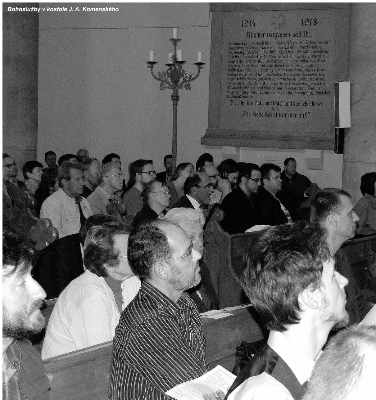
Bohoslužby v kostole J. A. Komenského

Možno, keď si niektorí delegáti konferencie prečítajú tieto riadky, povedia si, že sme neboli na rovnakej konferencii. Najmä tí nespokojnejší, ktorých hlasy neboli zaradené do znesení, lebo také bolo pravidlo. Ale aj oni vari pocítili, že v Brne na konferenciách Cirkvi bratskej vládlo ovzdušie, ktoré môže priniesť cirkvi len požehnanie a posilnenie. ■